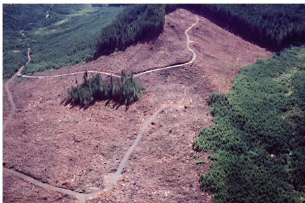
Kahlschlag/Abholzung im Great Bear Regenwald in Kanada.