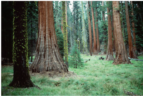
Great Bear Regenwald in Kanada

Vor allem dadurch, dass der Papierrohstoff oft aus Kahlschlägen stammt, die kaum Investitionen der Konzerne erfordern, werden die Preise für Zellstoff gedrückt. Das führt dazu, dass Zellstoff aus nachhaltiger Waldwirtschaft im Preis schwer mithalten kann und kaum eine Chance hat: Die Papierfabriken beziehen ihre Rohstoffe überwiegend aus dem Ausland und aus Urwaldzerstörung, die deutschen Waldbesitzer bleiben auf ihren Holzprodukten oft sitzen.