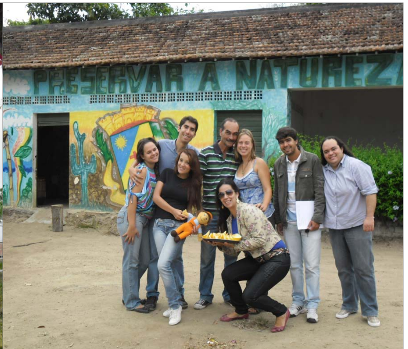
Ein Teil des DMA-Teams

Ich arbeite vorrangig mit den Arte-educadores zusammen, also den Menschen, die sich Aktionen zur Umweltbildung ausdenken und sie durchführen, sei es im Park, in Schulen, bei Stadtviertelfesten.. Bis jetzt sind kaum konkrete Aktionen geplant (Planung wird hier sowieso anders betrieben, als in Deutschland), aber neben dem Kennenlernen der verschiedenen Akteure hier (samt Chef, Rathaus, ..) sind schon folgende Dinge passiert bzw. in Planung: