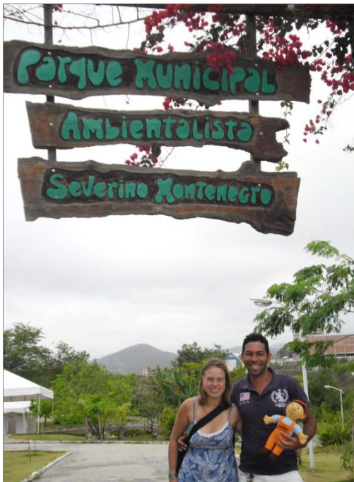
Der Eingang zum Park

Warum wir neben dem Essen und Dinge-kennenlernen hier sind, ist das ASA-Projekt "Umweltbildung". Es läuft hier in Brasilien in Zusammenarbeit mit den Sektoren "Wirtschaftsförderung" und "Umweltamt" der Stadtverwaltung von Caruaru. Im Umweltamt (Diretoria do Meio Ambiente= DMA) bin ich auch quasi täglich, es ist direkt an einem Park angeknüpft, den sie selbst angelegt haben. Parks wie diese gab es bisher in Caruaru nicht, daher ist dies ein recht neues Projekt. Schön ist er, es kommen regelmäßig Menschen, Schulklassen, finden Aktionen statt. Die Gäste müssen nur noch lernen, ihren Müll in die dafür vorgesehenen Abfalleimer zu werfen :)