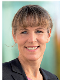
Eva Döhla Eva Döhla Oberbürgermeisterin

Demgegenüber bietet der Abfallzweckverband mit dem Verleih eines Geschirrmobils sowie von Geschirr und Besteck eine attraktive, umweltfreundliche und ansprechende Alternative. Es würde uns freuen, wenn Sie diese Möglichkeit nutzen würden. Viel Spaß beim Feiern wünschen Ihnen die Verbandsvorsitzenden